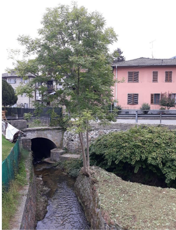
Vista dalle paratoie verso valle