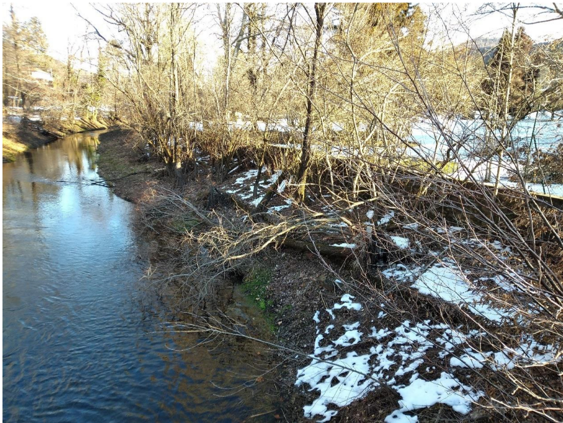
Tratto di corso d'acqua tra il lago e le chiuse