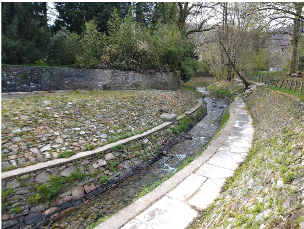
Vista dalle paratoie verso monte