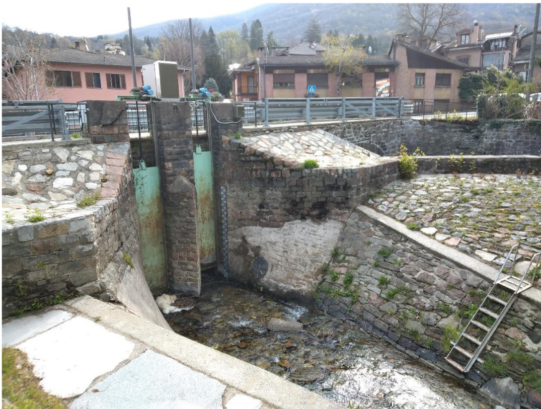
Vista paratoie da monte