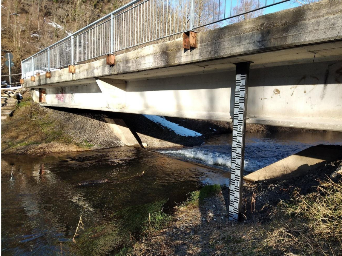
Inizio tratto manutenzione (ponte allo sbocco del lago di Ghirla)